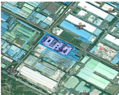
경남 창원시 성산구 완암로 50, 에스탱크엔지니어링(주) (제외)