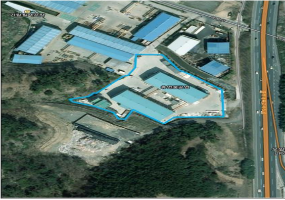
경남 함안군 칠서면 계룡로 110, 휴먼중공업(주) (추가)