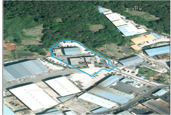
경남 김해시 한림면 가동로 9-24, (주)엔알텍 (추가)