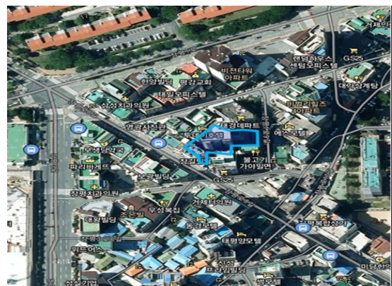
경남 거제시 장평동 368-4, 유니온(주) (제외)