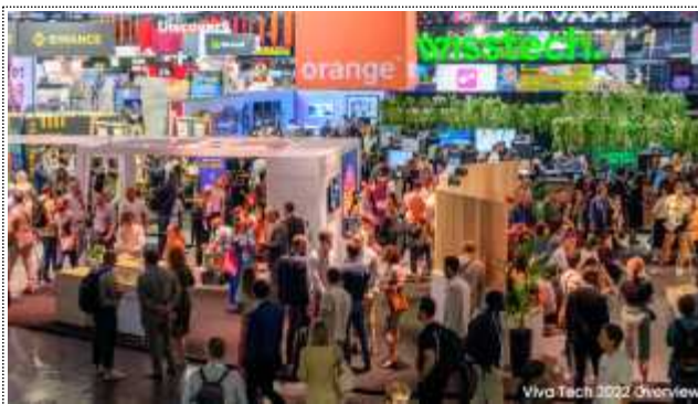
< 마크롱 대통령 컨퍼런스 >