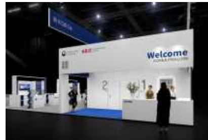
<현장유입 바이어 응대 인포데스크>