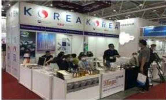
<기존 부스 전경>