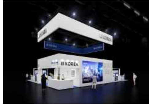
<대형 행잉배너, 디지털사이니지>