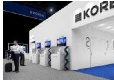
<한국 공동관 라운지>