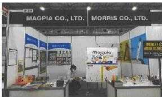
<상담 제공방식 부스>