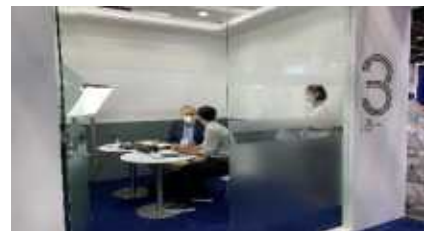
<온오프라인 비즈니스 미팅룸 조성>