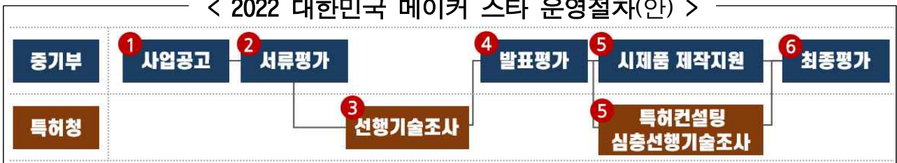
< 2022 대한민국 메이커 스타 운영절차(안) >

□ (운영절차) 서류평가(선행기술조사 포함) → 발표평가 → 제품제작 → 최종평가