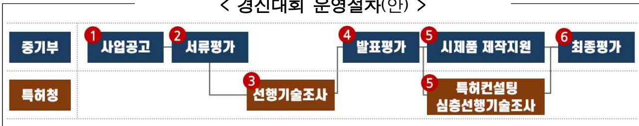
< 경진대회 운영절차(안) >