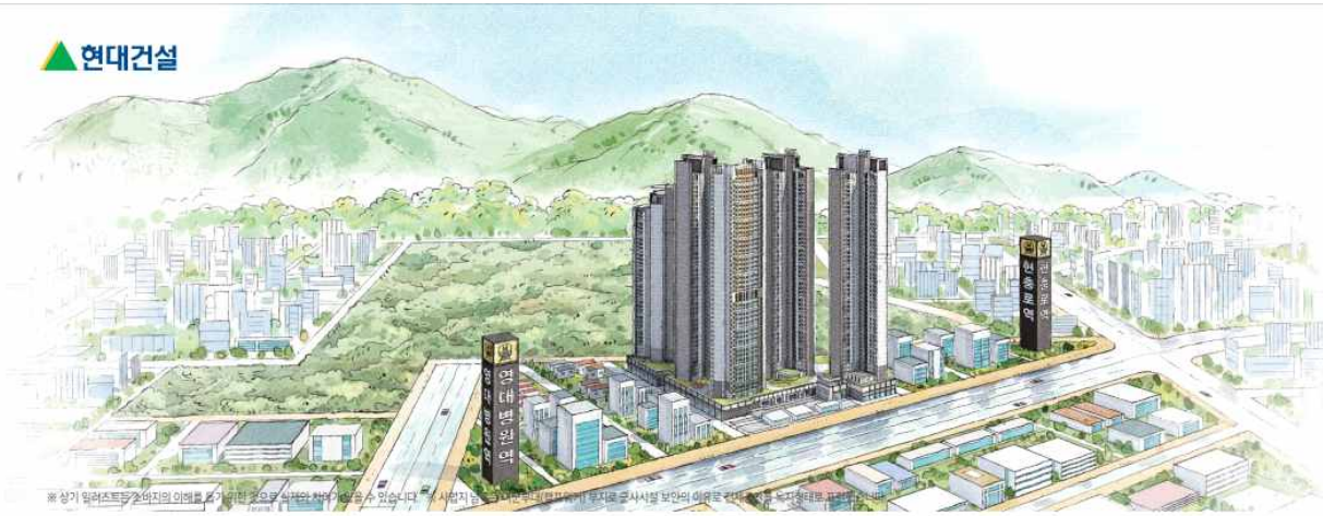
초특급 파노라마뷰의 앞산 49층 랜드마크 라이프 힐스테이트 대명 센트럴