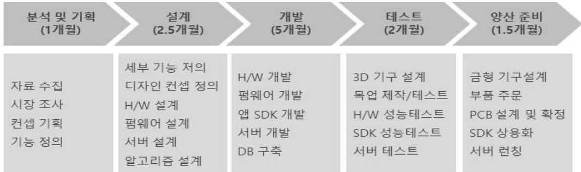
<제품 개발 프로세스>